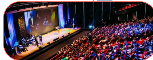
Beatrix Theater Utrecht