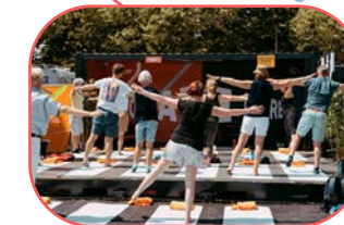
Vitality Experience Botanische Tuinen Utrecht